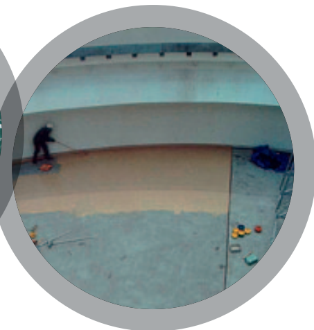
クラリファイヤー